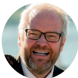
Magnus Sjöqvist, kompositör